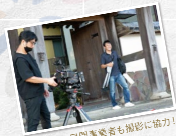
民間事業者も撮影に協力!