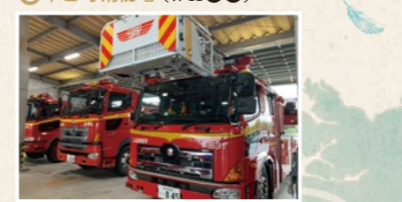
G 幸田町消防署(作品①②) 製作著作: CBCテレビ 現役の消防隊員も協力したドラマ『アイドル、よし!』では、消防署の対応力が光った。