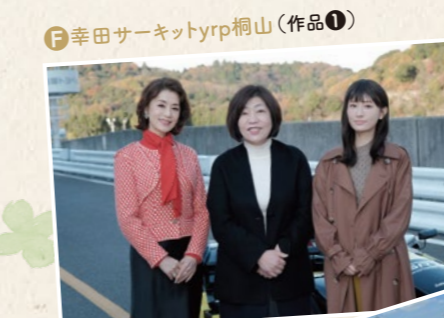
F 幸田サーキットyrp桐山(作品①) 写真提供: 東海テレビ・The icon ドラマ『最高のオバハン 中島ハルコ』撮影時には、原作者の林真理子さんも来場した。