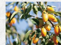
特産品の「筆柿」が ドラマに登場!