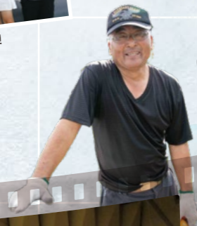
筆柿農家さんも 販売店の方も参加♪