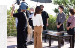
幸田のPR動画の撮影風景