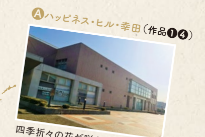
A ハッピーネス・ヒル・幸田(作品①④) 四季折々の花が咲き誇る人気のロケ地。名作のロケ地として名スポットになりそう。