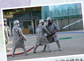
消防団の協力も! ドラマ『アイドル、よし!!』 製作著作：CBCテレビ