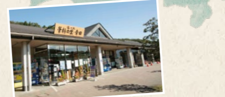
E 道の駅 筆柿の里・幸田(作品①) 幸田町の名産・筆柿は制作隊にも大人気! 2021年は売上も右肩あがりだったとか!