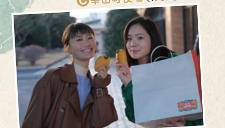
C 幸田町役場(作品①②) 役場もロケスポットとして登場! 撮影実績の展示などもあるのでチェックして。