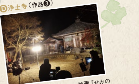
D 浄土寺(作品③) お寺での撮影も協力的! 映画『せみのこえ』でも柔軟な対応が喜ばれた。