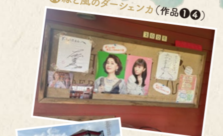
H 緑と風のダーシェンカ(作品①④) 出演者からも好評だったこちらのパン。地元の人気店として今後も注目!