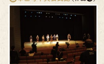
B 幸田町中央公民館(作品④) 映画『今はちょっと、ついてないだけ』の撮影を実施。のべ00名のエキストラが参加した。