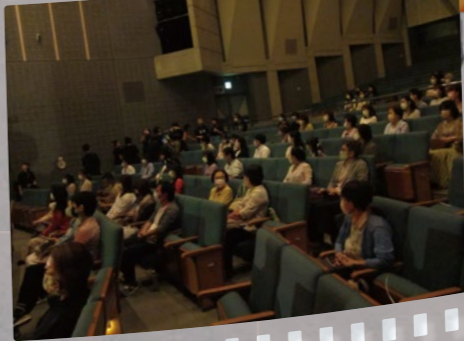
撮影隊が 撮った 一コマ