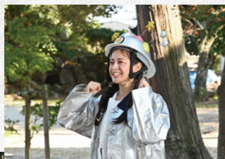
ドラマ「アイドル、よし!」 製作著作：CBCテレビ