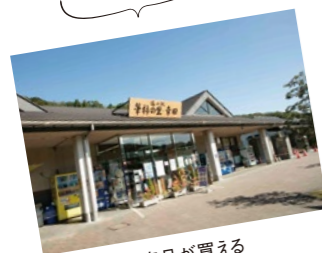
お土産や特産品が買える 「道の駅 幸田・筆柿の里」。 幸田町大字須美字東山17-5