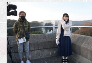
ドラマ「アイドル、よし!」 製作著作：CBCテレビ 写真（右）：越智ゆらの