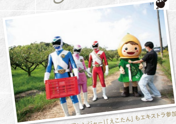
「幸田レンジャー」「えこたん」もエキストラ参加