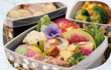
色とりどりの盛り付けに女優も感動!