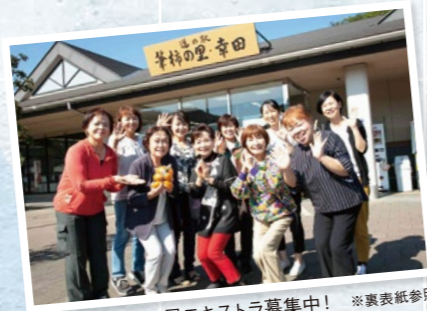
町民エキストラ募集中! ※裏表紙参照

真心がこもったロケ弁、差し入れ…… とても美味しかったです。 優しさが詰まった町の風景…… ずっと心に残っています。 そして、多くの皆さんにエキストラとして 参加していただいたロケ。 笑顔と、元気と、愛をたくさんもらいました。 心より感謝いたします。 そして、出来上がった作品は誰のものでもありません。 皆さん一人一人の作品です! (本当にありがとうございました!!) プロデューサー：渋谷未来