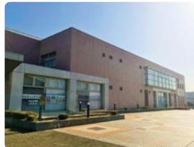
「幸田町民会館」 演劇、コンサート等、幅広いイベントで利用されるホール。 ☎0564-63-1111 幸田町大字大草丸山60

ロケツーリズムに取り組んでから2021年に3年目を迎えた愛知県幸田町。役場を中心とした官民の取り組みが制作者から評判を呼び、テレビや映画での露出が増えてきている。ドラマ『最高のオバハン 中島ハルコ』では、幸田町の特産品がドラマに多く登場したことから、視聴者からの問い合わせも増え、地元でのロケに対する理解の深まりも感じられる。そんな町の厚いロケ対応に、映像クリエイターからは多くの感謝の声が届く。「また幸田町で撮影をしたい」という声が多いことから、ロケツーリズムでのPRに力を入れている。