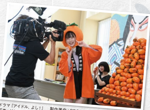
ドラマ「アイドル、よし!」 製作著作：CBCテレビ