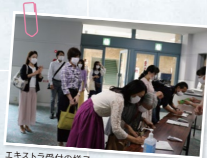
エキストラ受付の様子