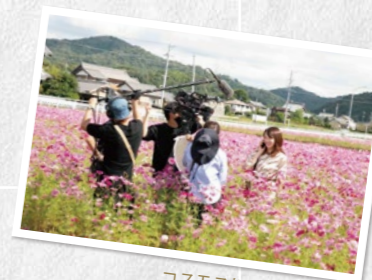
コスモス畑での撮影風景