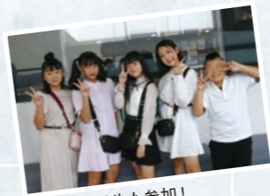
町内の中学生も参加!